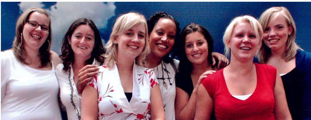
medewerkers bloem 2

Aan de directie de taak om de randvoorwaarde te scheppen, zodat zij hun werk zo goed mogelijk kunnen doen. Wij trainen onze medewerkers regelmatig op allerlei gebied, zoals veiligheid, pedagogiek of beweging. Hierdoor kunnen zij nog beter hun werk doen. Alle medewerkers beschikken over de vereiste diploma's zoals onder andere SPW3 of SPW4 en over een verklaring omtrent gedrag van het ministerie van justitie. De GGD inspecteert ieder jaar al onze medewerkers op deze gegevens. Een lijst met erkende diploma's voor pedagogisch medewerkers die werken in de kinderopvang vindt u op onze website.