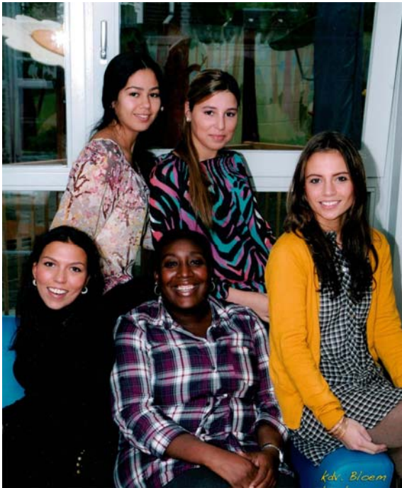
medewerkers bloem 1

Onze medewerkers dragen ons kinderdagverblijf en bepalen voor het meeste belangrijke deel de kwaliteit van het kinderdagverblijf. Hoe meer zij zijn gemotiveerd, hoe beter zij zijn opgeleid en hoe meer ontvankelijker zij zijn voor de kinderen en hun wereld, hoe beter het kinderdagverblijf.